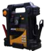
第一代 铅酸电池启动电源

QDSP 源自于英文Quick Discharge Start Power, 是电将军公司独有的启动电源技术, 在第二代锂电池启动电源的基础上实现了同等容量的情况下, 最大启动电流可提升3-5倍, 特别在低温情况下启动能力有明显提升, 同时第三代产品上使用了双向快充技术, 充电口使用TYPE-C接口可实现快充快放。